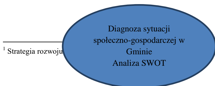
Schemat 2. Procedura opracowywania i wdrażania LPRG

Procedura opracowywania i wdrażania LPRG została zaprezentowana na schemacie 2